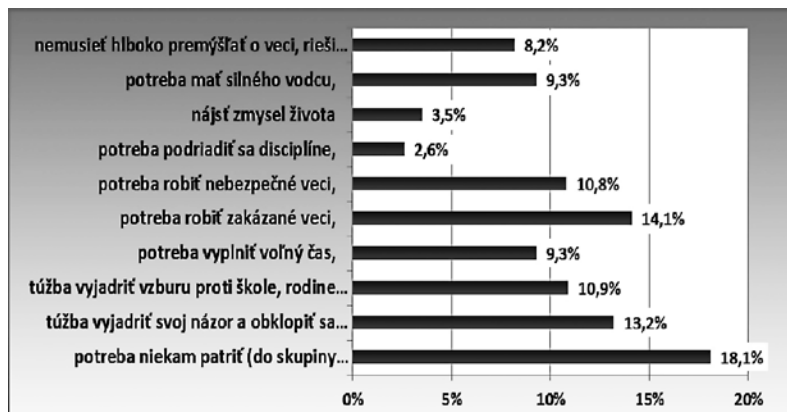
Graf č. 1 Vnímanie dôvodov vedúcich mladých ľudí stať sa extrémistami.

Okrem percepcie spoločnosti, prečo sa jednotlivec stáva extrémistom, nás zaujímalo hodnotenie dôvodov, prečo sa mladí ľudia stávajú členmi extrémistických skupín. Aby množstvo týchto dôvodov nebolo príliš veľké a ťažko spracovateľné, ponúkli sme opäť množinu odpovedí, z ktorých respondenti mohli zaškrtnúť maximálne tri. Išlo o nasledujúce ponúknuté možnosti odpovedí: