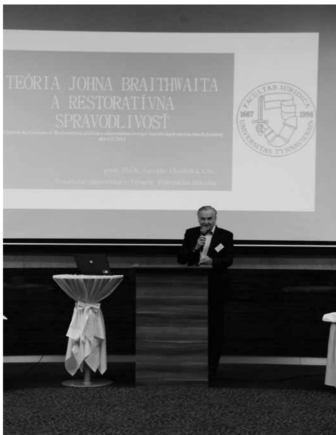
Medzinárodná vedecká konferencia „Restoratívna justícia a alternatívne tresty v teoretických súvislostiach“, Trnava máj 2014.