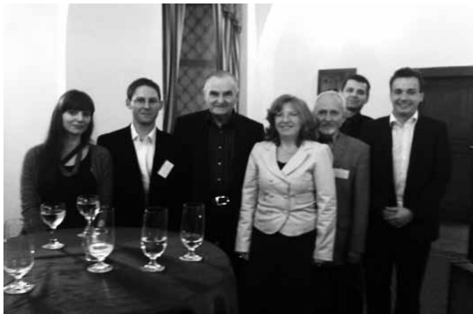
Medzinárodná vedecká konferencia organizovaná Českou kriminologickou spoločnosťou, Praha 2013.