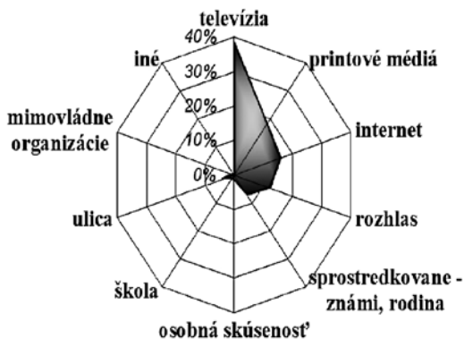
Graf č. 5 Rozloženie odpovedí na otázku, z akého zdroja sa respondenti najčastejšie dozvedajú o extrémizme.

Podobne aj internet sa stáva veľmi významným zdrojom tak pozitívnych, ako aj negatívnych informácií.