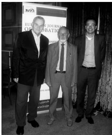
Medzinárodná vedecká konferencia – 50. výročie Inštitútu pre kriminológiu a sociálnu prevenciu, Praha september 2010.