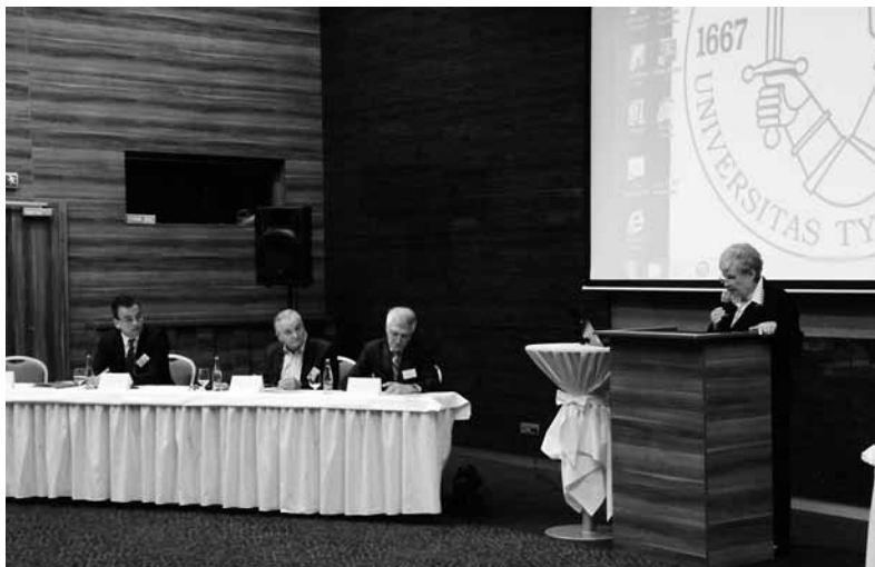
Medzinárodná vedecká konferencia „Restoratívna justícia a alternatívne tresty v teoretických súvislostiach“, Trnava máj 2014.