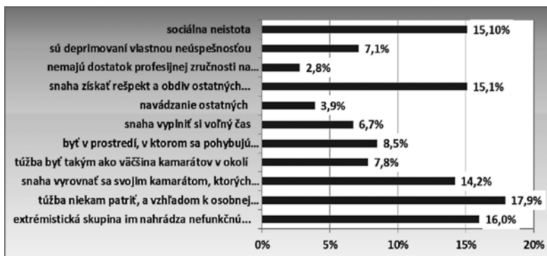
Graf č. 2 Percepcia dôvodov, prečo sa mladí ľudia stávajú členmi extrémistických skupín.

Ďalším z ponúknutých dôvodov, prečo sa stáva mladý človek členom extrémistických skupín, je podľa takmer 1/10 respondentov snaha byť v prostredí, v ktorom sa pohybujú obdivovaní vodcovia , nasledovali odpovede respondentov, ktorí ako dôvod uviedli snahu byť takým, ako väčšina kamarátov v okolí, ďalej, že mladí ľudia sú depri-