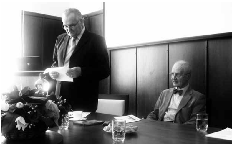
Medzinárodná vedecká konferencia „Metodológia kriminologického výskumu“, Trnava 2011.