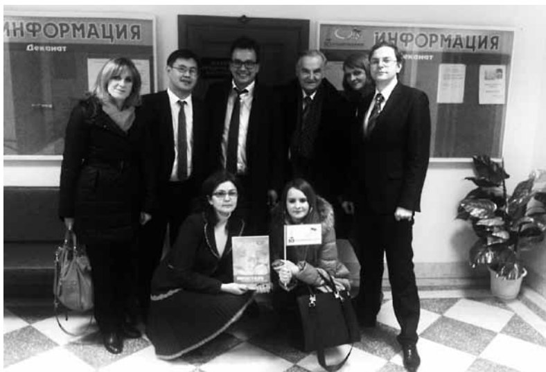
Medzinárodná vedecká konferencia „The counteraction of Ethnic, Religious and Youth Extremism“ Omsk december 2014.