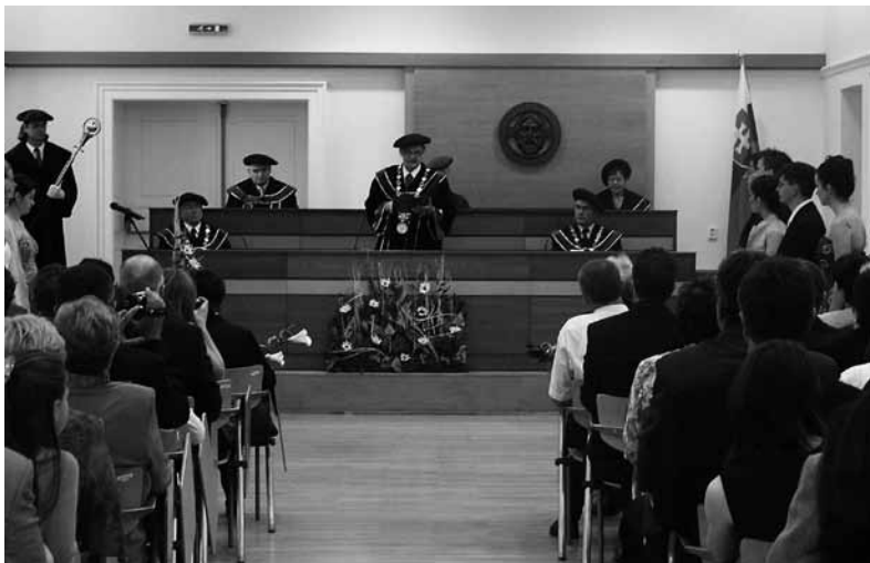
Magisterské promócie na Trnavskej Univerzite v Trnave, Právnickej fakulte, Trnava máj 2005.