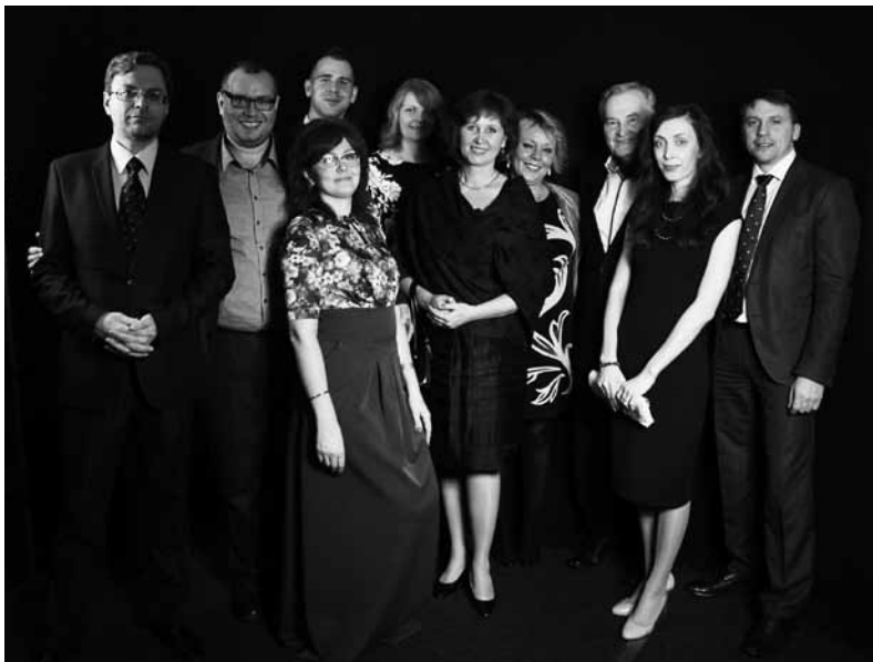
Beáňa Právnickej fakulty Trnavskej univerzity v Trnave, Trnava november 2014.