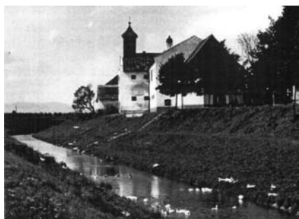
Pohľad na lazaret od Trnavky