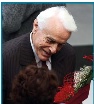
Na FF prví emeritní profesori