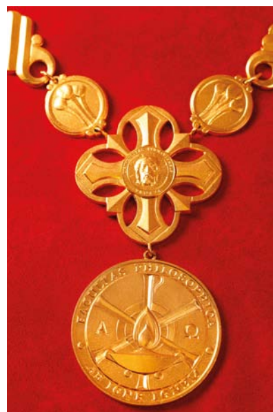
Foto súčasnej dekanskej reťaze s medailou