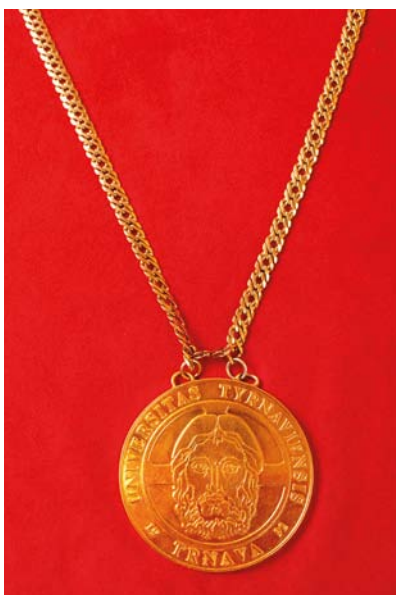
Foto pôvodnej dekanskej reťaze s medailou