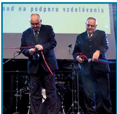
Beáňa Trnavských univerzít