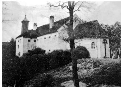
Lazaret s kostolíkom sv. Fabiána a Šebastiána na fotografii z prvej polovice 20. storočia

Trnavskej univerzity a miesta klinickej praxe v Trnave