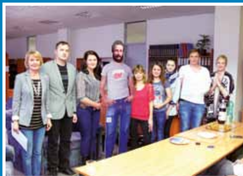
Ludovít Štúr medzi nami súčasníkmi