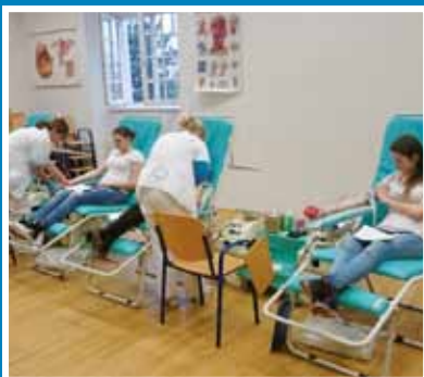
Študentská kvapka krvi