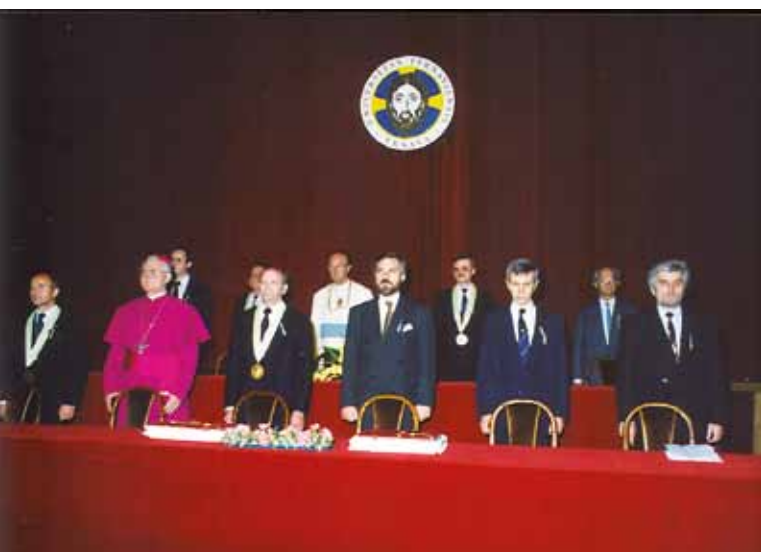
Z inaugurácie obnovenej Trnavskej univerzity 8. novembra 1992