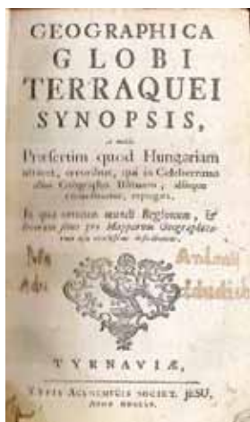
Geographica globi terraquei Synopsis. Tyrnawia MDCCCLV.

Podľa trnavského vydania učebnice geografie z roku 1745 vznikol neskôr, v rokoch 1759 – 1760, slovensky písaný rukopis Krátke poznamenáni sweta to gest: Malý spis kragén, mést, wód, áno y národuw rozličných. Roka Páne 1759 dokonané 1760 . Autor textu je dosiaľ neznámy, ale je pravdepodobné, že text vznikol v prostredí Trnavskej univerzity. Nebol však koncipovaný ako vysokoškolská učebnica, ale ako popularizujúca ľudovýchovná príručka o svete, Európe a Uhorsku. O Trnave sa píše v rámci Bratislavskej župy: Druhe kralowske mesto Tyrnawa, znessene w kragne od učeny vysokych skol, od arcykapytuly ostrychomskeg, od mnohych recholnykuw, od mladych knezuw, který se tu cwyczá w sskolskem umenji; techto pak domy gsu: S. Stephana, S. Adalberta, Matky bozeg a Czerwenych. Krom techto konwykt kralowsky pro zemanske ditky. Staweny hodne nakladkuw kragynských. Pole okolo rowne a hoyne . Autorovi za zmienku stála okrem Ostrihomskej kapituly len univerzita ( wysoká sskola ), pričom rozlišuje úplné a neúplné vysoké školy. Rozdiel medzi vysokými a vrchnými školami vysvetľuje takto: Kdežkoly položeno: wysoké skoly, wysoké učeny, má se rozumeti: wsselyké učeny lyterne. Kdež ale: wrchne skoly anebo učeny, ma se rozumeti, že tam syce neny wssecko učeny, ačkoly nekteřé z wyssoch skol. Tak ku prykladu: W Uherskeg nasseg kragne w Tyrna-